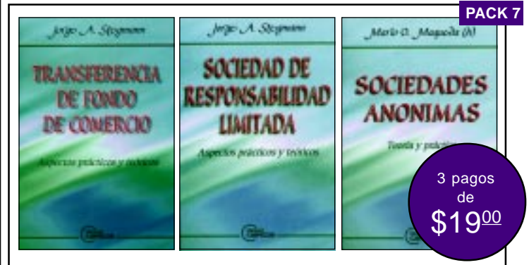
UNA TRILOGÍA PERFECTA PARA EL DERECHO COMERCIAL

Tres publicaciones de autores de prestigio cubren las necesidades para estas fiestas de aquellos que se dedican al Derecho Comercial