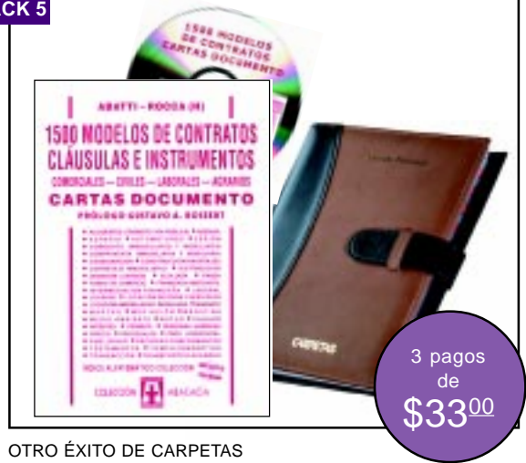
OTRO ÉXITO DE CARPETAS